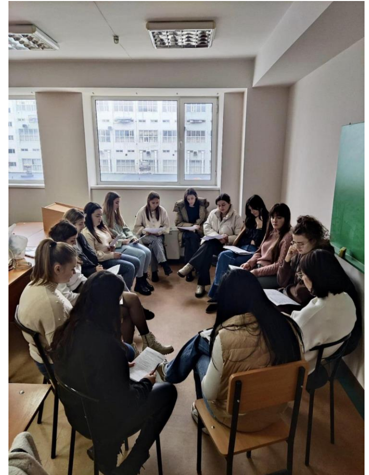
Atelierul de lucru “Activități de diagnostic în practica psihologică contemporană”

Această perspectivă presupune ca direcții concrete de acțiune activități de formare și dezvoltare profesională a studenților, activități de expertiză, consiliere și cercetare, precum și activități de suport și servicii competente, de calitate, centrate pe persoană, în acord cu dinamismul unei societăți bazate pe cunoaștere și competitivitate.